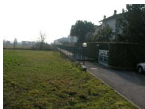
le villette sul lato ovest