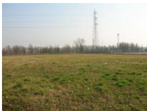
vista verso est

A est si apre la campagna libera ed in particolare una zona di alberi con dietro un boschetto vero e proprio.