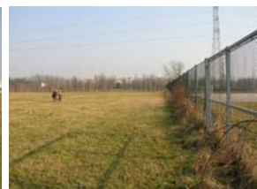
la recinzione campo di calcio