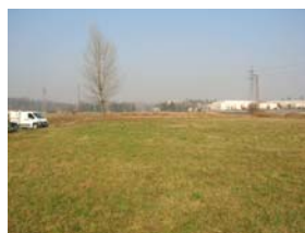
l'area verso nord con il pioppo